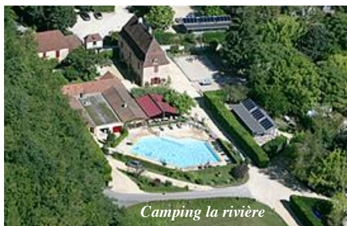
Camping la rivière

Hébergement au camping « la rivière », 3 route du sorcier, 24620 LES EYZIES DE TAYAC SIREUIL : autour de 87€